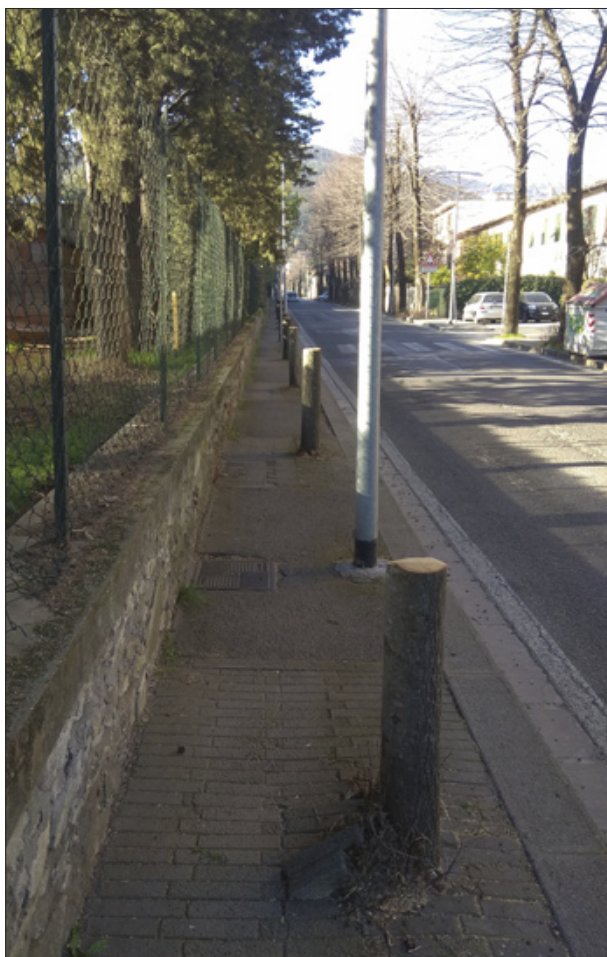
▲ Abbattimento seriale di giovani tigli lungo il viale XX settembre a Sesto Fiorentino (Fi), 2019.