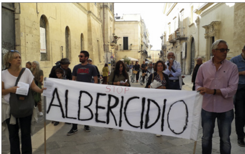
◀ Manifestazione a Lecce contro il taglio degli alberi (novembre 2022).