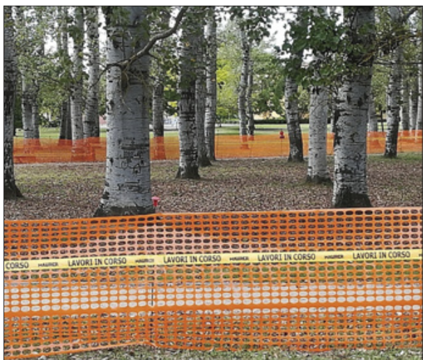
▼ Oltre 100 pioppi abbattuti a Firenze, nel 2019, Pioppeta del Galluzzo.

A Milano, durante le festività natalizie, ben 83 alberi secolari sono stati abbattuti senza preavviso, davanti allo