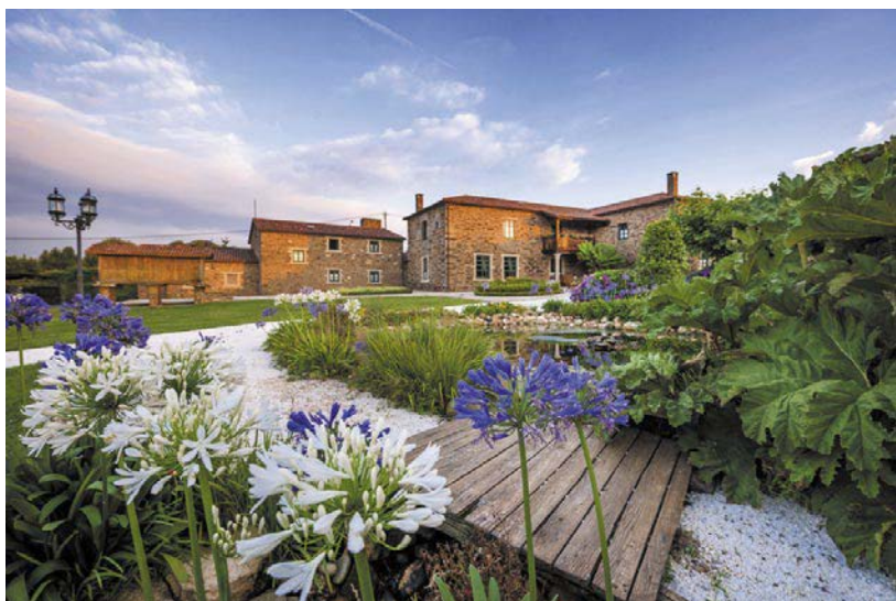
▲ Una casa tradizionale in Galizia pronta ad accogliere nuovi ospiti.