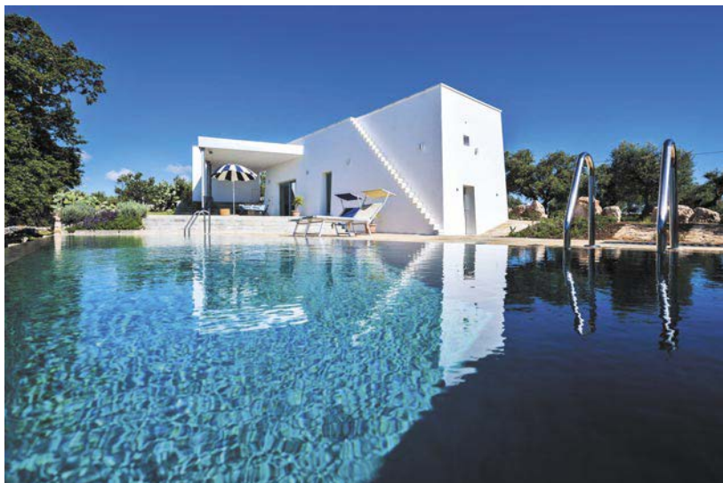
▲ C'è chi sceglie di scambiare casa invece di affittare ai turisti. Nella foto, una casa con piscina vicino al mare, in Puglia.