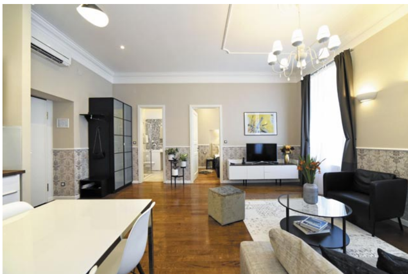
▲ Spazi grandi, case ben curate, la generosità degli host è davvero sorprendente. Nella foto, gli interni di un'abitazione in scambio a Zagabria (Croazia).

sempre più numerose. Si può optare sia per lo scambio diretto, sia per una gestione più flessibile. In entrambi i casi non c'è passaggio di denaro, ma solo la contabilizzazione di un punteggio, a cui si aggiungono una serie di garanzie offerte dalla relativa piattaforma.